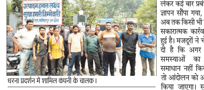
धरना प्रदर्शन में शामिल कंपनी के चालक।

कर दिया। कर्मचारियों का कहना है कि लंबे समय से मांग रखने के बावजूद कंपनी प्रबंधन उनकी समस्याओं का समाधान नहीं कर रहा है। इससे आक्रोशित होकर उन्होंने शांतिपूर्ण ढंग से धरना प्रदर्शन शुरू किया है। टेका श्रमिकों ने बताया कि पिछले कई महीनों से वेतन में अनियमितता बरती जा रही है। समय पर भुगतान नहीं होने से मजदूरों को