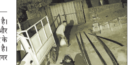
चोरी करता युवक।