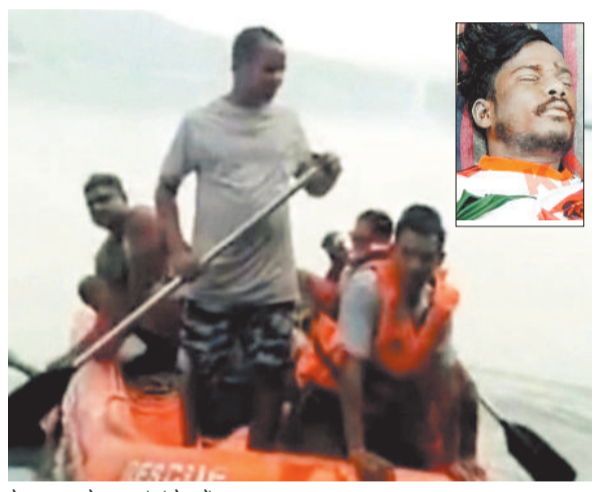
रेस्क्यू करते हुए एवं इंसैट में मृतक।