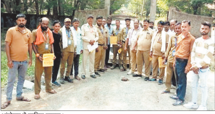
आंदोलन में शामिल चालक।

उल्लेखनीय है कि छत्तीसगढ़ ड्राइवर महासंघ अपनी 11 सूत्रीय मांगों को लेकर स्टेयरिंग छोड़ो चक्काजाम आंदोलन शुरू कर दिया है। महासंघ ने साफ चेतावनी दी है कि जब तक सरकार उनकी मांगों को पूरा नहीं करती, तब तक यह हड़ताल जारी रहेगी और प्रदेशभर में कोई भी यात्री या